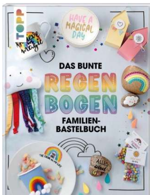
Buchcover: © buchhandel.de