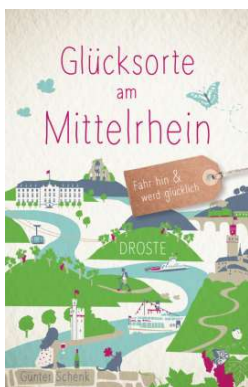
Buchcover: © buchhandel.de