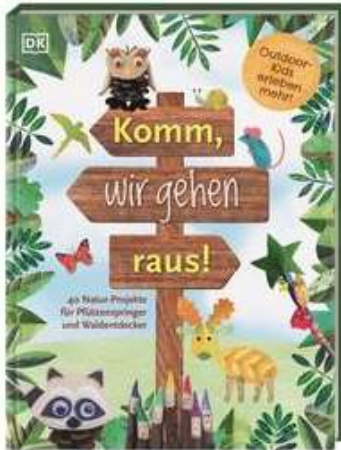
Buchcover: © buchhandel.de