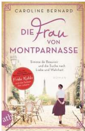
Buchcover: © buchhandel.de