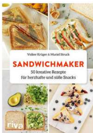
Buchcover: © buchhandel.de