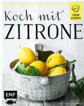
Buchcover: © buchhandel.de