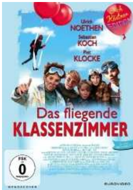
DVD-Cover: © buchkatalog.de