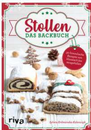
Buchcover: © buchhandel.de