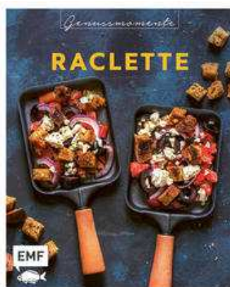
Buchcover: © buchhandel.de