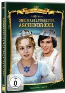
DVD-Cover: © buchkatalog.de