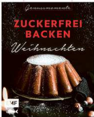
Buchcover: © buchhandel.de